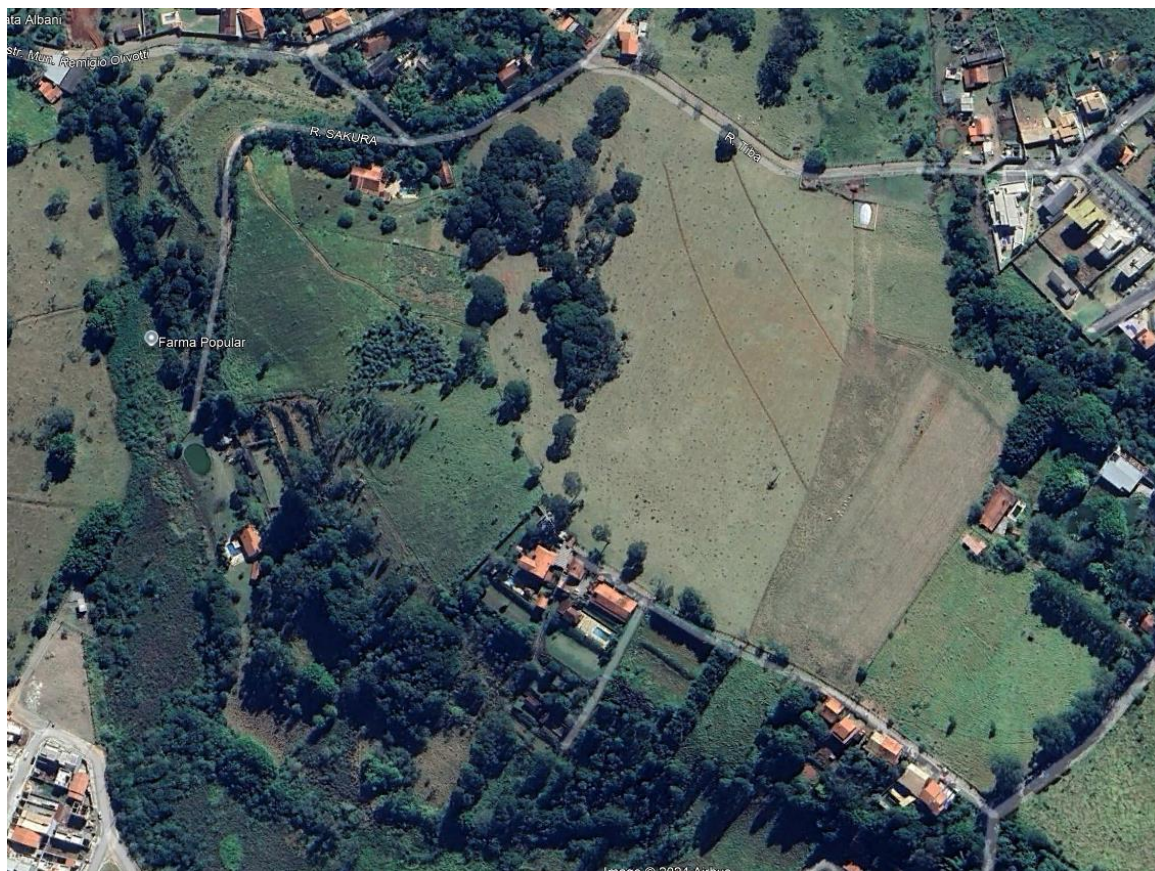
Vista de satélite do local da obra.